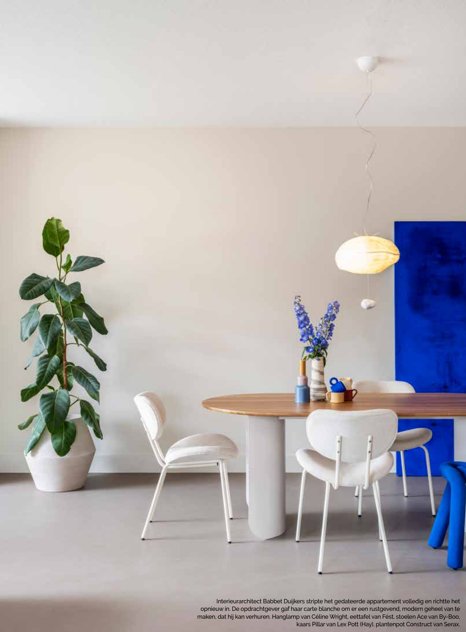
Interieurarchitect Babbet Duijkers stripte het gedateerde appartement volledig en richtte het opnieuw in. De opdrachtgever gaf haar carte blanche om er een rustgevend, modern geheel van te maken, dat hij kan verhuren. Hanglamp van Céline Wright, eettafel van Fést, stoelen Ace van By-Boo, kaars Pillar van Lex Pott (Hay), plantenpot Construct van Serax.