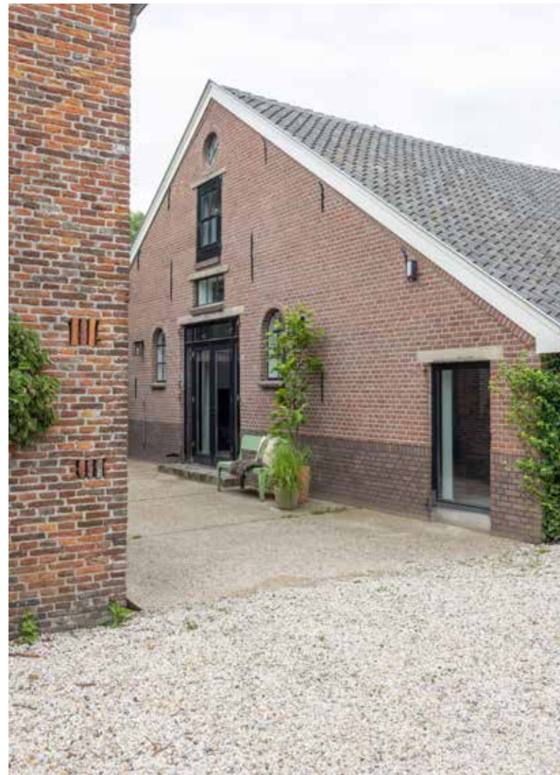
Rechts: De dwarshuisboerderij dateert uit de tweede helft van de zeventiende eeuw.