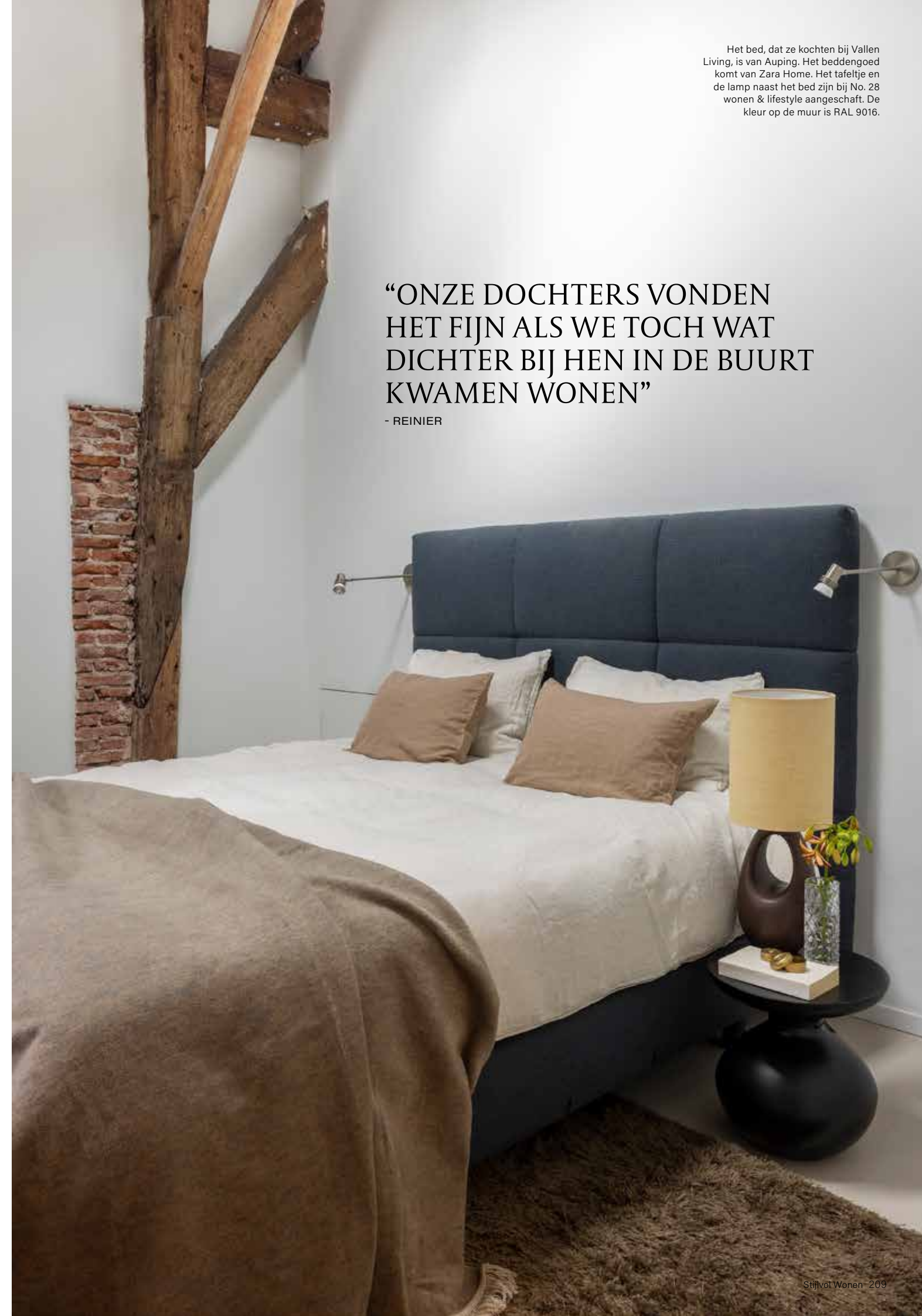
Het bed, dat ze kochten bij Vallen Living, is van Auping. Het beddengoed komt van Zara Home. Het tafeltje en de lamp naast het bed zijn bij No. 28 wonen & lifestyle aangeschaft. De kleur op de muur is RAL 9016.

“ONZE DOCHTERS VONDEN HET FIJN ALS WE TOCH WAT DICHTER BIJ HEN IN DE BUURT KWAMEN WONEN”