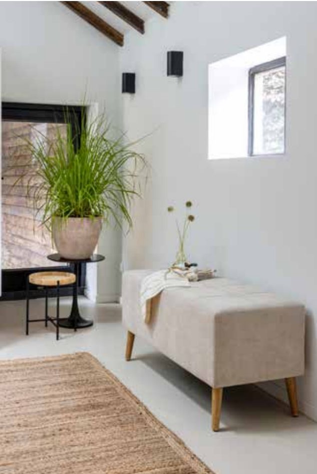
Boven: De badkamer is gerealiseerd door Van Manen Badkamers. Op de vloer en op de wand zijn tegels Ivory gebruikt, in verschillende maten. De accessoires in de badkamer zijn van Meraki.